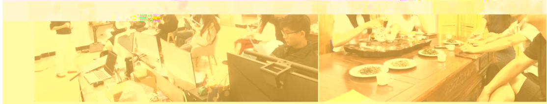
邀请企业专家教学及企业游学